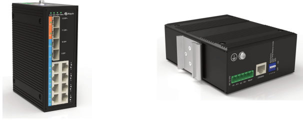
二层管理型工业交换机